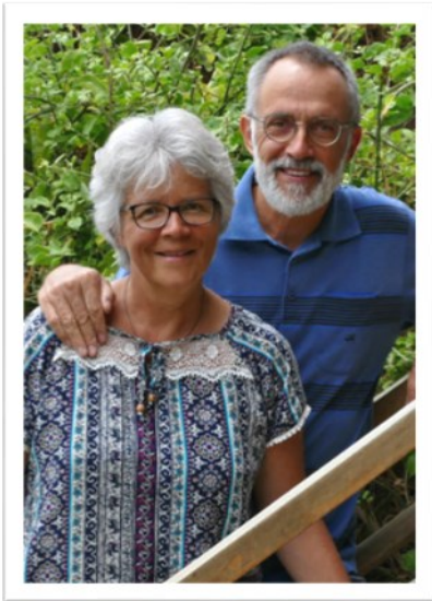
Und die Grosseltern freuen sich mächtig...!