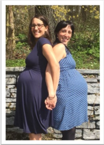
Eine 'bewegende' Sache – die beiden werdenden Mütter bestätigen es!