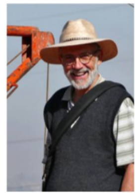
Der Vorarbeiter meint, auch der Fotograf dürfe bei den Erinnerungen nicht fehlen