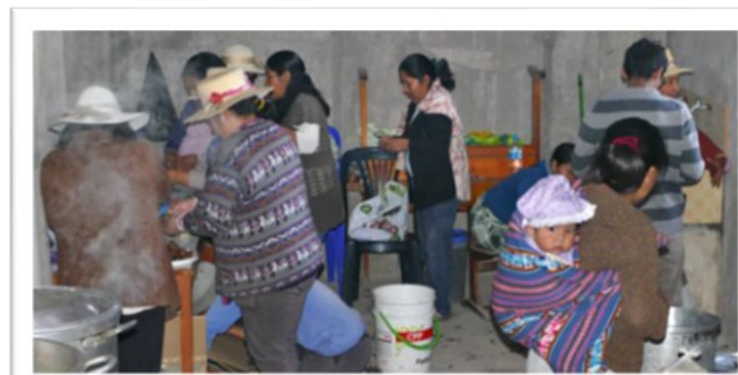
Auch in der Küche geht es emsig zu und her...