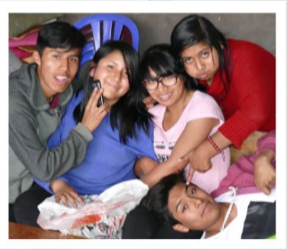
Die Teenager genießen das Zusammensein...