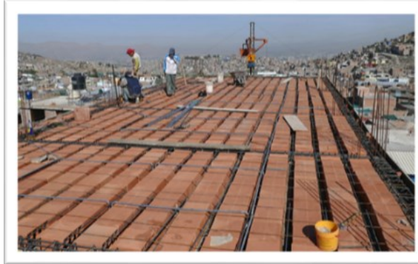
In den Tagen zuvor wurde alles bestens vorbereitet...