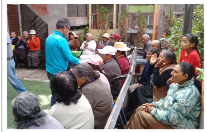
Betagte Menschen im Kinderheim von Arequipa – bei froher Gemeinschaft