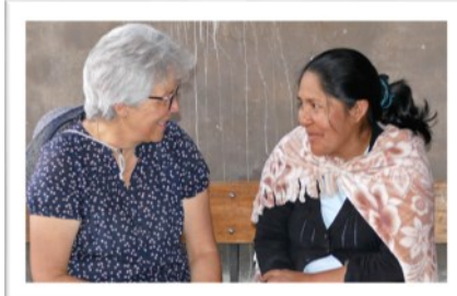
und auch für gute Gespräche bleibt Zeit!