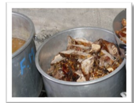
'Cancatscho' - im Ofen gebratenes Alpaca-fleisch - mmmmh, darauf freuen sich alle!