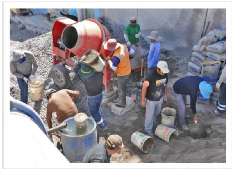
Bei der Betonzubereitung braucht es die meisten Hände...