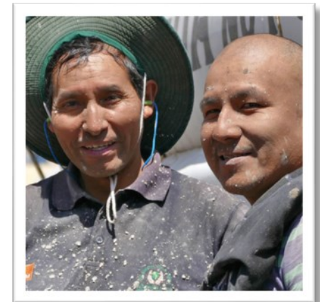
...und nicht nur die Hände werden schmutzig...