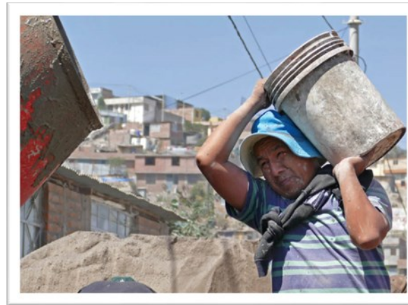
Recht anstrengende Sache...